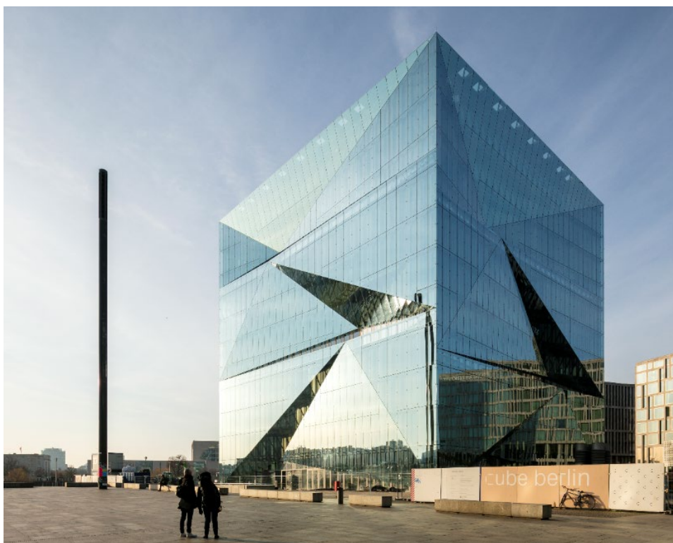
cube berlin, Europacity

В таком умном здании будущего способная к обучению интеллектуальная техника будет адаптироваться к индивидуальным требованиям пользователей. Следовательно, cube berlin, поддерживая новые концепции работы в офисе, позволяет оптимизировать управление объектом и экономить ресурсы.