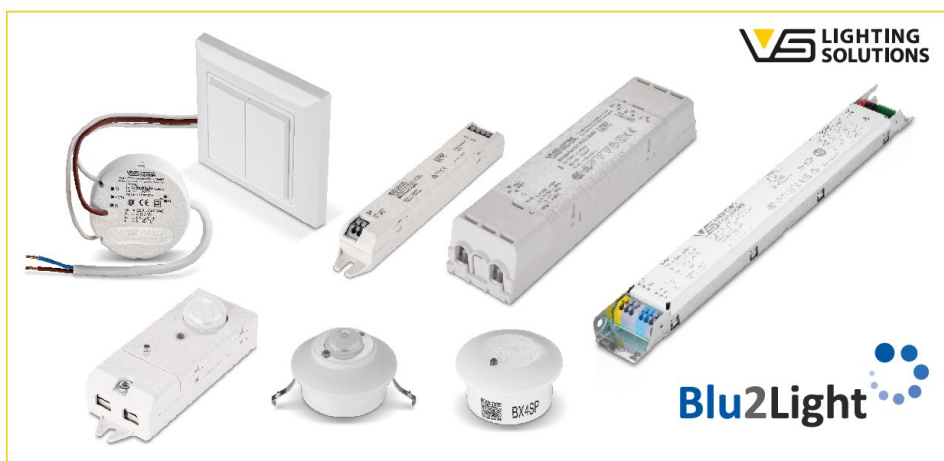
Blu2Light-System