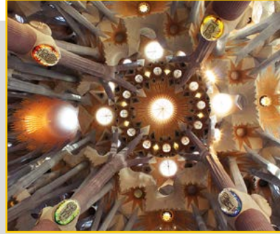
Blick an die Decke der Basilika